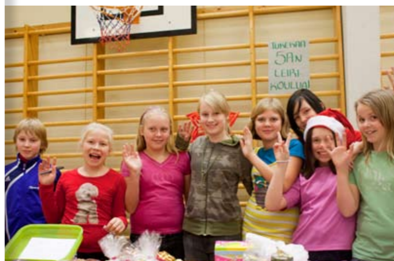
Luokka 5 A:n iloista myyjäisväkeä.