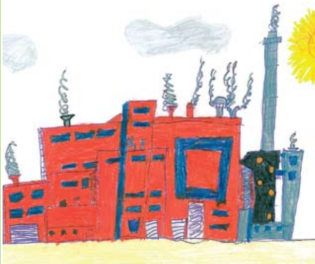
Hyötyvoimalaitoksen on piirtänyt Niilo Nissinen.